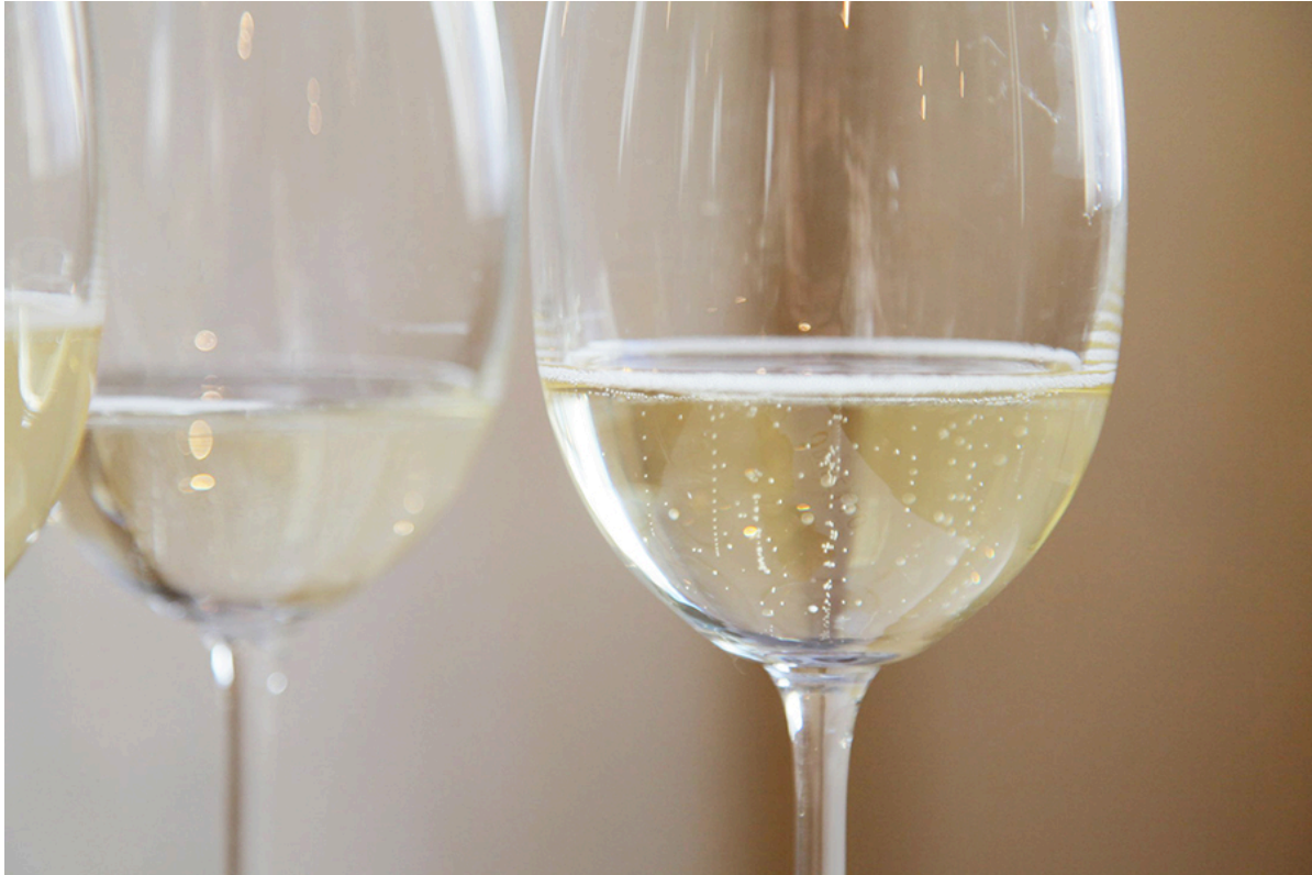
La Doc Monti Lessini sarà dedicata solo allo spumante Metodo Classico

Lessini Doc. Dall'indagine risulta che il 51% degli intervistati desidera sperimentare un Metodo Classico nuovo , fatto in Italia (78%), su territori collinari (54%) o in altitudine (10%), su suoli vulcanici (18%), e con una fascia di prezzo ideale che si colloca tra i 10 e i 20 euro a bottiglia (36%).