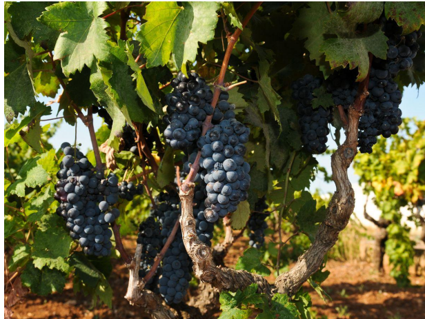
Grappoli di negroamaro (Foto © Alessandra Piubello).

La Doc istituita nel 1976 beneficia dell'impegno del Consorzio Salice Salentino, molto attivo in diverse iniziative di promozione della denominazione e delle bellezze del territorio